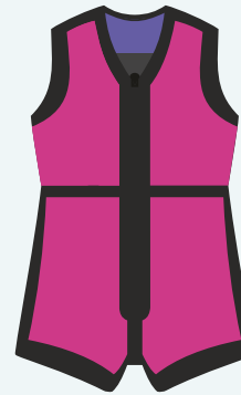
V4 Pink Farbkombination verschiedene Stoffe und Bänder