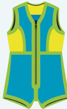
V3 Neongelb/Türkis Damenanzug mit Brustabnäher