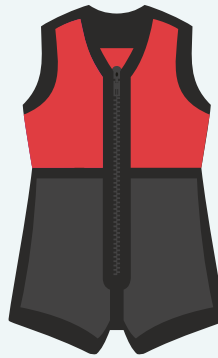
V1 Schwarz/Rot Farbkombination verschiedene Stoffe und Bänder