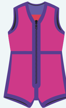
V4 Pink Farbkombination verschiedene Stoffe und Bänder