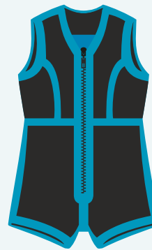
V2 Schwarz Damenanzug mit Brustabnäher